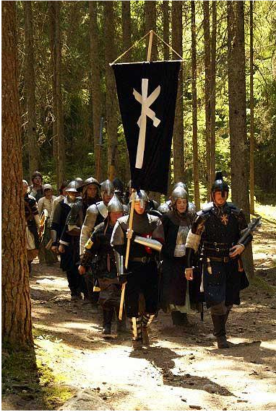
Furstliga soldater på marsch