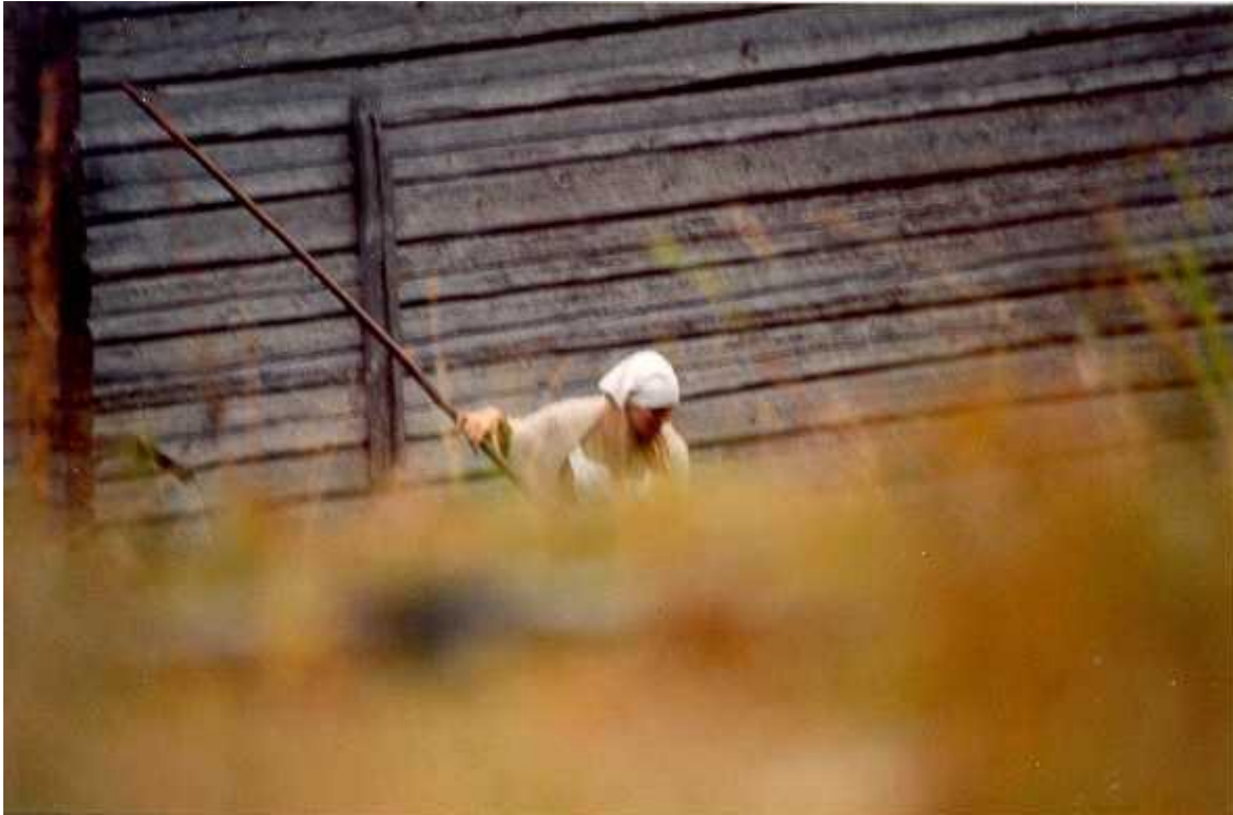
En arbetande bonde i Rödesta

Här följer lite mer bakgrund om trakten, huvudsakligen för dem som ska spela roller från bygden eller regelbundna besökare. Övriga kan hoppa över det här avsnittet.