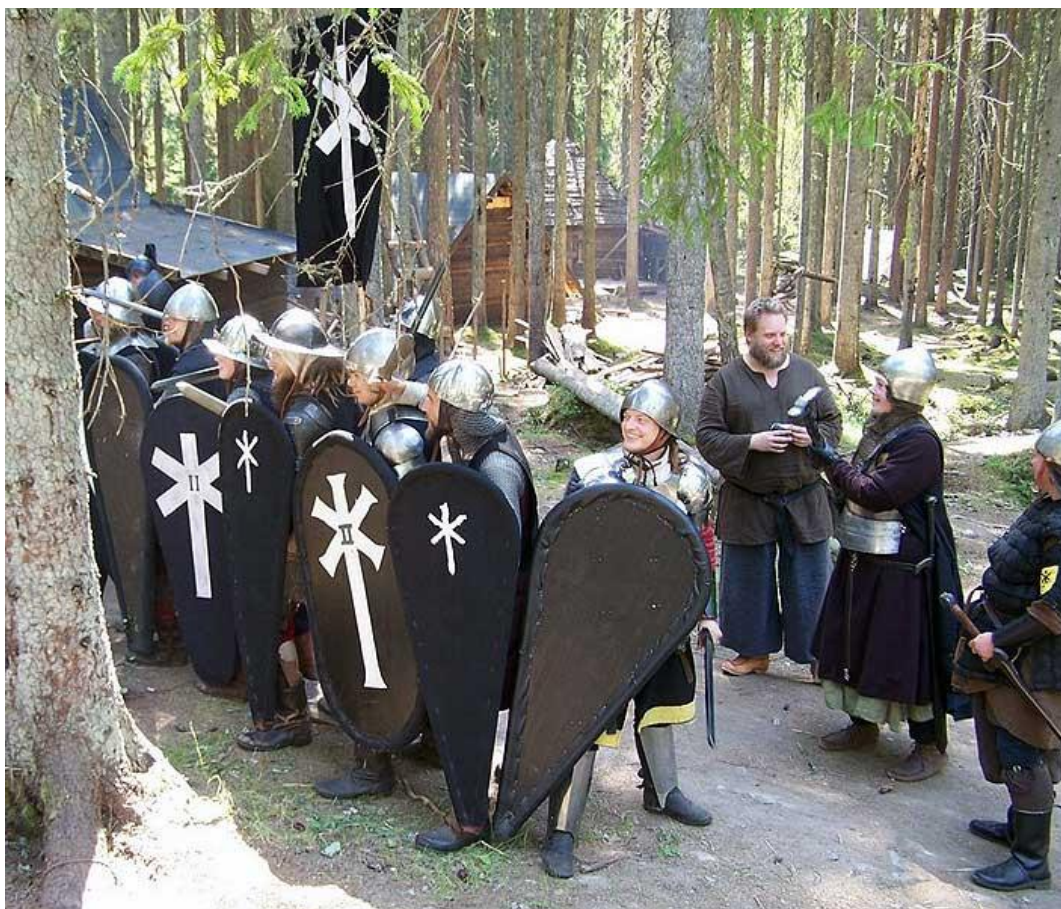
Furstliga legionärer under stridsövning