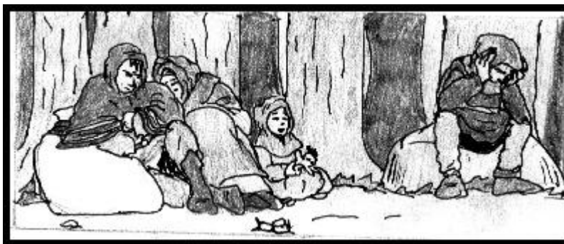
Några flyktingar vilar vid väggkanten

För att göra hela lajvets utrustningsnivå så bra som möjligt kommer vi att uppmuntra och vid behov hjälpa till att samordna lån och utlån av utrustning. Detta kommer främst att ske via lajvets forum.