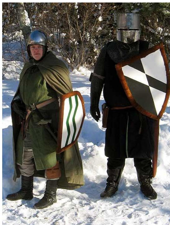
Två gedanska riddare, rustade för strid till fots

Alla vidare utskick kommer om inget annat görs upp att gå via mail. Om du inte kan eller vill ta dem via mail kan du få papperskopior till självkostnadspris (ring eller maila för överenskommelse).