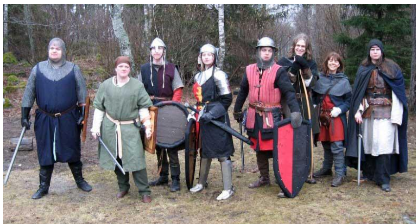
En blandad skara gedanska och sunnanslättiska krigare