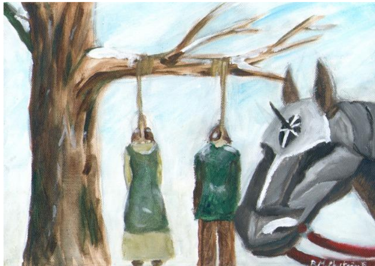
"Upproret dränktes i mina vänners blod"

Åren gick och på något sätt gick livet vidare där hemma. Efter blodsnätterna för sju år sedan har min hembygd förskonats från det värsta av krigets ofärd, och barnen i min släkt minns inte längre en tid före Furstens. Men jag minns.