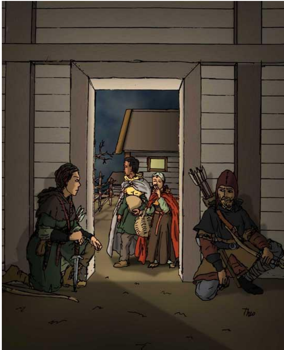
Ett par bybor smugglar ut förnödenheter till gömda motståndskämpar