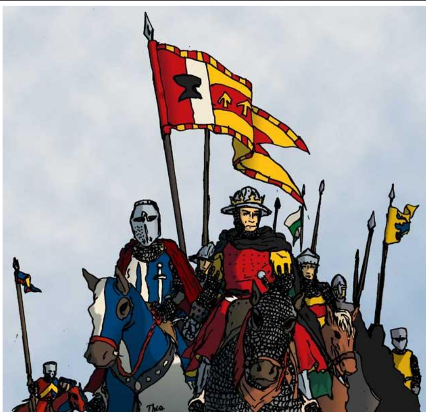
Kung Angantyr av Arosia i fält

Vi skriver nu Ljusets År 1148. Sedan segern vid Geda har våra folk kämpat för att återta sina förlorade