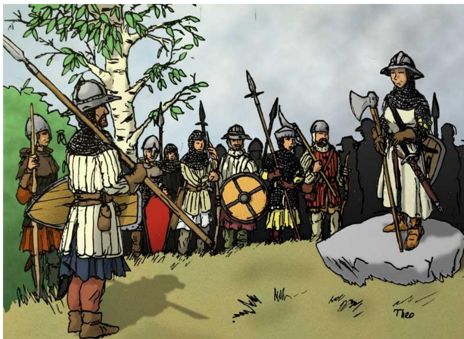
Gedanska bondesoldater samlade inför fälttåget