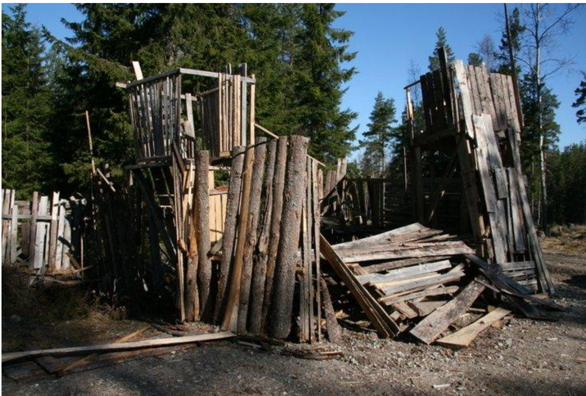
Resterna av ett raserat Furstligt vaktorn inte långt från Rödesta

När den Furstliga fältarmén lämnade bygderna för en tid sedan lämnades ganska starka garnisoner kvar, starka nog för att kunna parera lokala oroligheter i väntan på förstärkningar. När upproret kom och man samtidigt hotades av en stark allierad här från söder kunde de dock inte hålla sina ställningar, och nu är många av deras fästen övergivna. De flesta av garnisonstrupperna har dragit sig samman på det starka Vidmarkshus, men en del isolerade utposter finns fortfarande kvar – däribland en inte långt ifrån Rödesta.