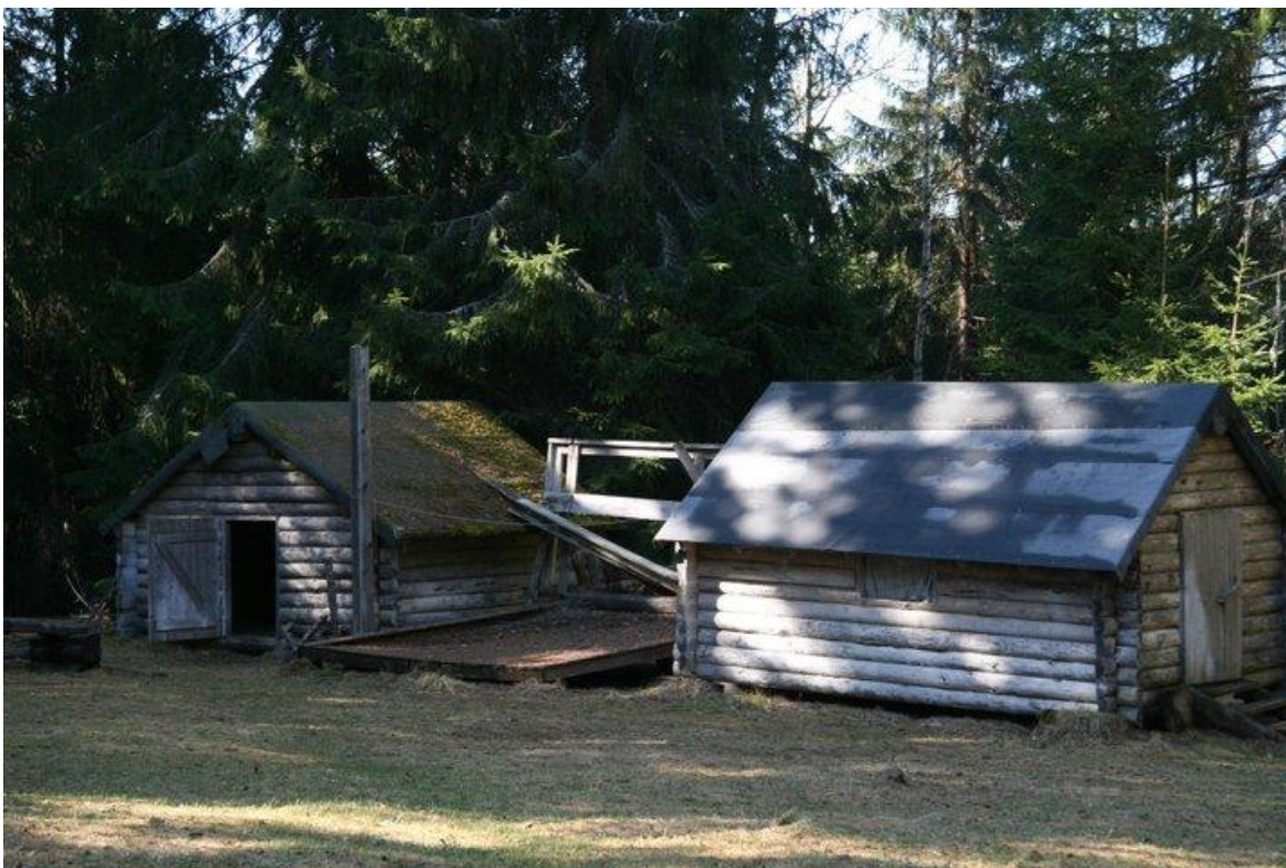
Två av stugorna i byn

Om man inte har möjlighet att vara med hela lajvet finns det möjlighet att delta under en del av tiden. Hör av dig till arrangörerna om det.