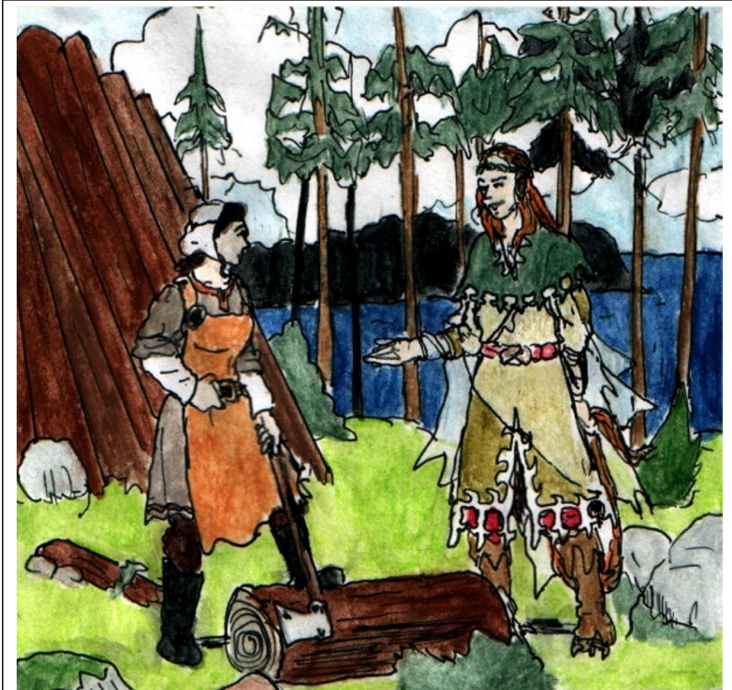
En och annan av nybyggarna vid Världens Ände sades ha råkat på skogsrån...

Det detaljerade rollformuläret ska användas för att beskriva rollen. Instruktioner för att fylla i det följer med de olika gruppbladen, eftersom det är mycket som är så olika för olika typer av roller.