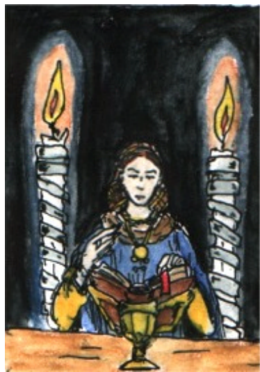
En av Nyckelns Väktare studerar de gamla skrifterna

Ur moder Elarka Arnvidaes, abbedissa i Örnevall, diarium: