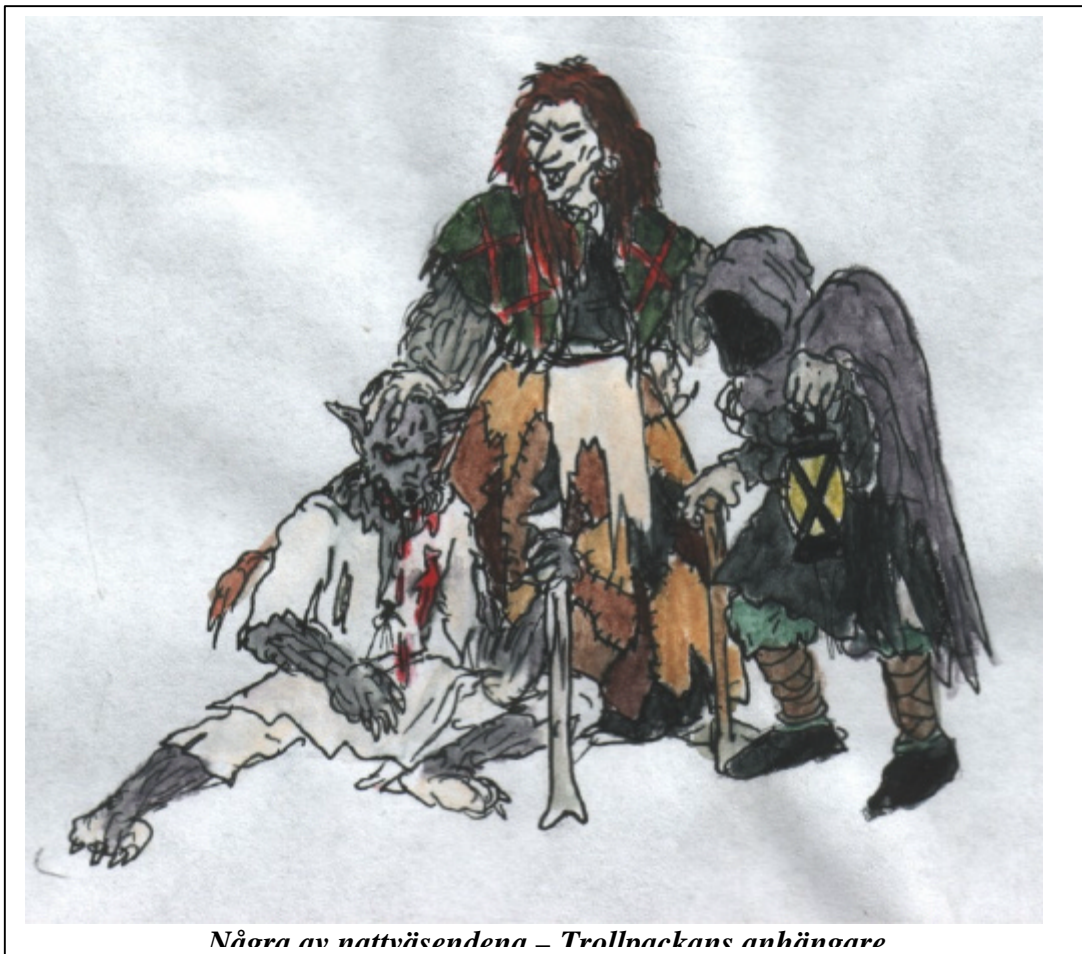
Några av nattväsendena – Trollnackans anhängare

Sist men inte minst är det ett viktigt delmål för oss att göra ett lajv där de övernaturliga elementen i storyn – besvärjelser och ritualer, oknytt och vålnader – inte bara gestaltas utan gestaltas bra , på ett sådant sätt att det verkligen blir effektivt och stämningsfullt. Det magiska på Källan vid Världens Ände kommer inte att fungera som ett taktiskt vapen som ger regeltekniska ”fördelar” utan kommer att fylla sin funktion som en del av sagan – både som stämningsinslag och, vid några tillfällen, även för att föra handlingen framåt.