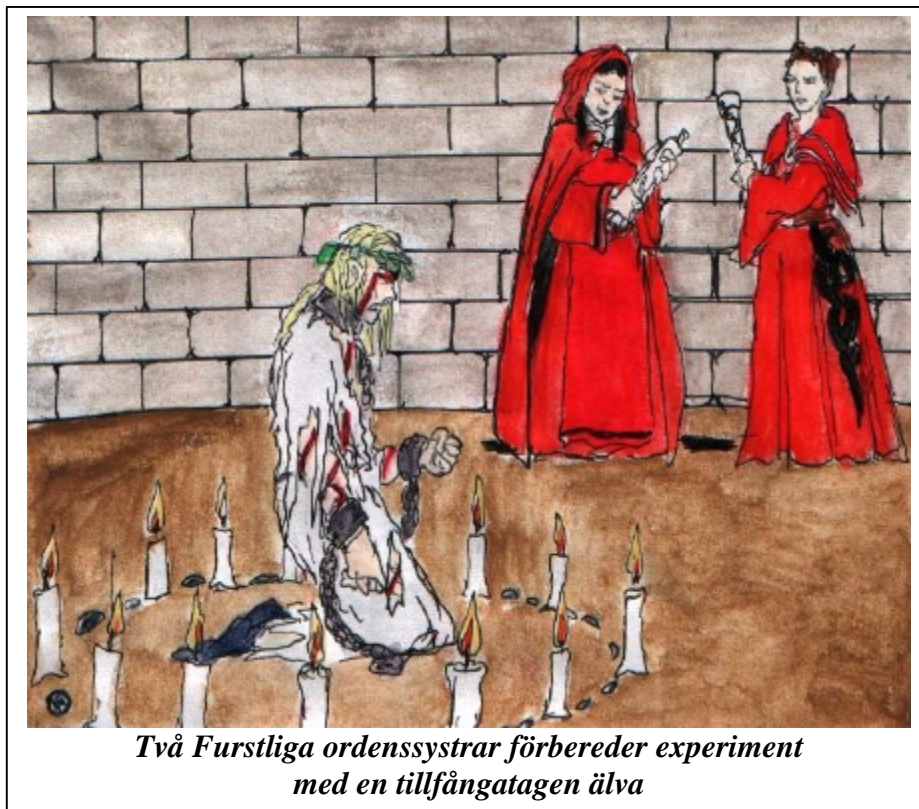
Två Furstliga ordenssystrar förbereder experiment med en tillfångatagen älva

Ganska lite är känt om Furstendömet Margholien för de utomstående. Av den fasad som före kriget visades upp i handelsorten Strand kunde man se att det var en invecklad hierarkisk tjänstestat stödd på en väl-drillad här av yrkessoldater. Såväl tjänstemän som krigare tycktes till allra största delen värvade utifrån, från såväl andra länder i Thule – inte minst de Norra Kungarikena – som annorstädes. Den infödda befolkningen levde som enkla bönder eller arbetade på de nyanlagda skogs och bergsbruken.