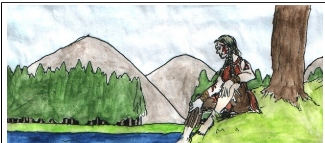
En vildkvinna av Björnstammen

Eftersom vi anser att onykterhet och rollspel inte hör ihop, både ur säkerhetssynvinkel och med tanke på det offmoment verkligt påverkade deltagare utgör, har vi en genomgående restriktiv hållning till alkohol. På många tillställningar är alkoholintag helt förbjudet. På vissa tillåter vi alkoholhaltig måltidsdryck; även där måste det dock röra sig om små mängder och brukas med måtta. Det är alltid helt förbjudet att bli märkbart onykter. Exakt vilka regler som gäller för det aktuella lajvet kommer att framgå tydligt i dess utskick.