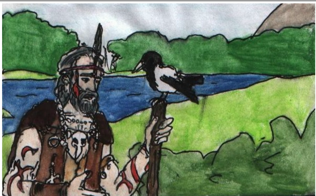
En bekymrad shaman av Älgstammen

Den grupp som är med på Källan vid Världens Ände är inte hela Älgstammen utan en mindre flock, bestående av flera grupper. Dessa är av två slag: dels familjegrupper med föräldrar och barn eller