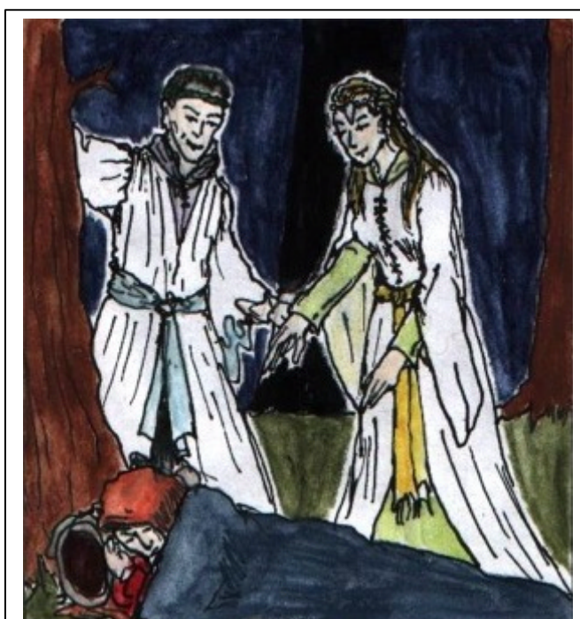
Två älvor överraskar en sovande skogsvandrare

Våra älvor påminner om dem i gammal svensk folktro – vackra och eteriska, stolta och oberäknliga, ibland livsfarliga. De har också lånat en del inspiration från litterära förebilder, framför allt Shakespeares En midsommarnattsdröm .