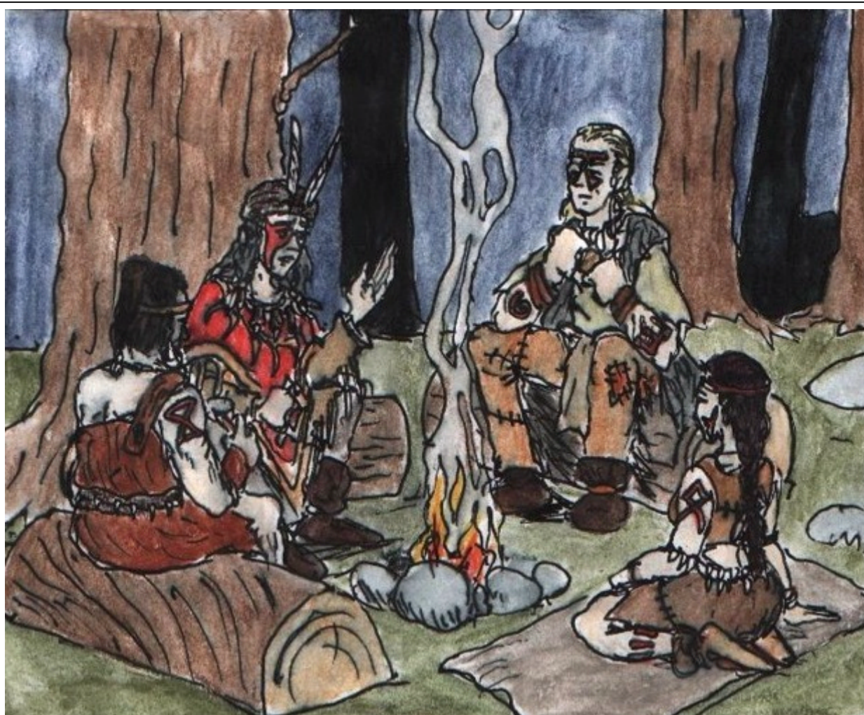
Rödhake och några av hennes lärjungar

Snöuggla och våra andra vise har vandrat bland andarna, och de har sett mörka skuggor över vårt folk. Skugghjärta har våra fränder i norr helt i sin makt, och hans falske profet dryper sitt gift bland våra syskonstammar. Kanske har han fått också Älgstammen i sitt våld, kanske finns hopp om att de ska vakna. Men har han förlött dem, då får inte bojan vid Världens Ände falla i deras händer. Redan ligger vår fiendes skugga över horisonten, och även Råandarna fruktar hans makt.