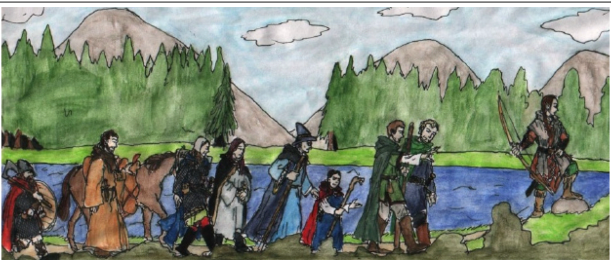
Nyckelns Väktare på vandring mot Världens Ände

Hela kampanjen är i grunden en episk saga om kampen mellan gott och ont . Det är viktigt för oss att framställa en sådan konflikt på ett intelligent och nyanserat sätt. En i grunden svart-vit konflikt blir lätt förenklad och ytlig. Det behöver dock inte bli så. Det går att skapa berättelser om gott och ont