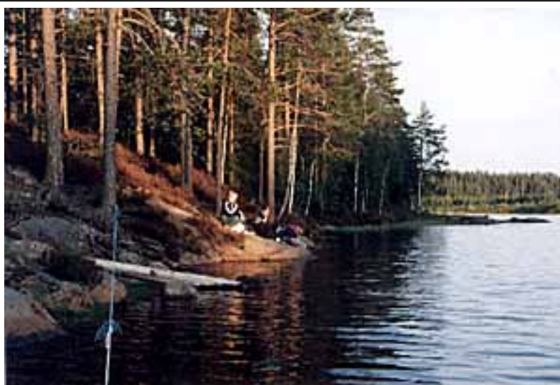
En bit av sjön mitt på området

Slutligen kommer det att finnas med ett antal "hemliga" roller av olika slag på lajvet, som vi av olika skäl inte kan beskriva närmare i utskicket. De flesta av dessa kommer att vara med endast under en del av spelet och kan därför komma att kombineras med andra roller. Skulle du vara intresserad av någon mer tillfällig uppvisning eller inhopp så hör av dig till oss.