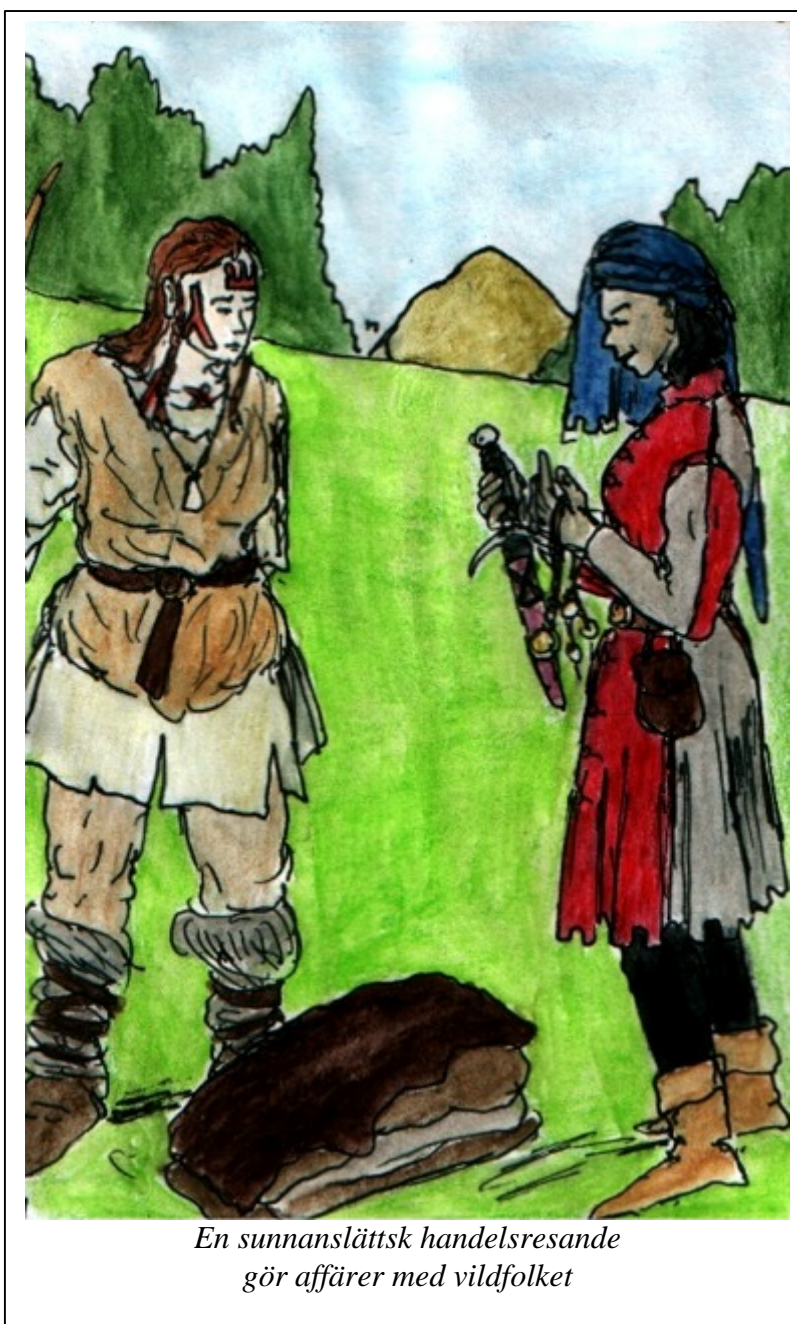
En sunnanslättsk handelsresande gör affärer med vildfolket

Vi kommer som vanligt att försöka hjälpa till att låna ihop blank- och boffervapen vid behov. Den som har något eller några extra blankvapen och kan tänka sig att låna ut det är välkommen att höra av sig.