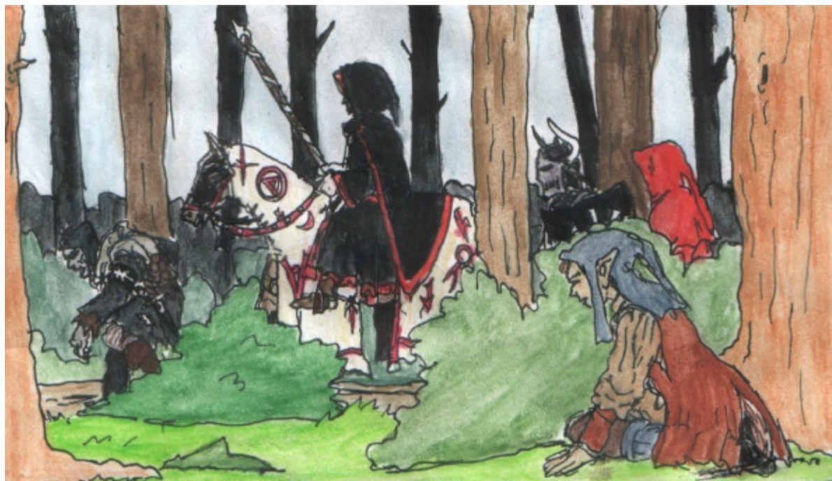
Furstens utsända på väg till Världens Ände

Att de Furstliga tvivelsutan är skurkarna i dramat – såväl på Källan vid Världens Ände som på kampanjen i stort – betyder inte att samtliga Furstliga roller behöver vara stereotyp och endimensionellt onda. De flesta är helt enkelt cyniska lycksökare som tjänar Fursten för att det lönar sig – och det gör det; såväl soldater som tjänstemän är väl och pålitligt avlönade. Dessa är rätt likgiltiga för hur det går i längden så länge de själva klarar sig – samtidigt kan de ha en sträng "yrkesheder" och ta sin tjänst och uppgifter på stort allvar. Andra är mer "idealistiska" och tror verkligen på Fursten som världens räddare och framtid.