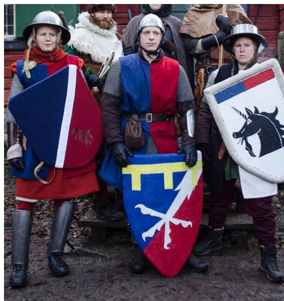
Riddar Akvin Örnklo d y med följe

Vi kommer att ordna ett mer detaljerat schema för iordningställande och städning inklusive att utse ansvariga funktionärer. Detta kommer att skickas ut före lajvet när det är klart och även finnas uppsatt på plats.