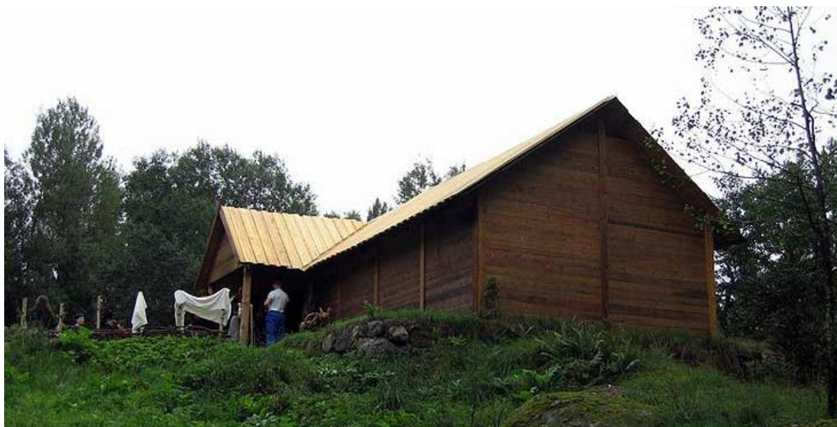
Långhuset; huvudbyggnaden på Edsätra

Svar: Du har gått för långt ner i backen. Gå tillbaka tills du ser en asfaltsväg på vänster sida, ta in där.